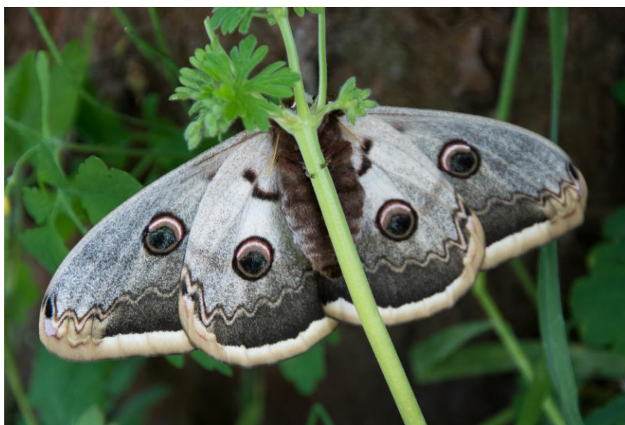
Obr. 6 Dospělec – samice (Vrané nad Vltavou).