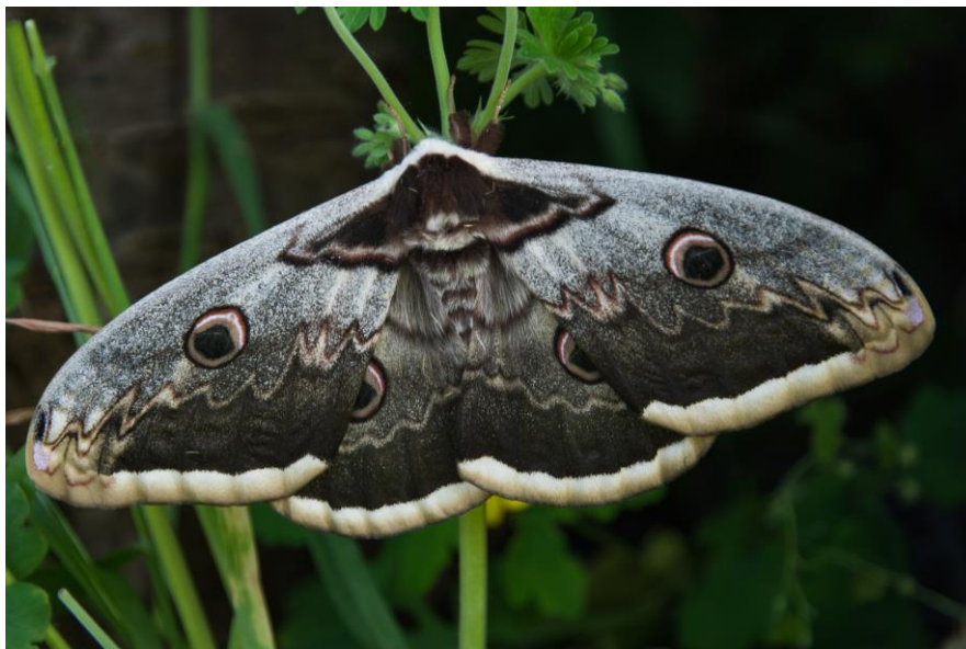
Obr. 5 Dospělec – samice (Vrané nad Vltavou).