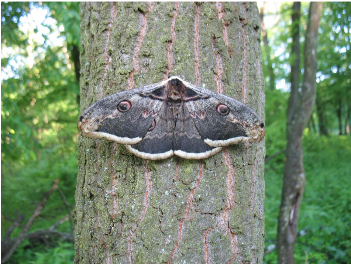
Obr. 1 Samec sedící na dubovém kmenu (Břeclavsko).

2 Společnost pro ochranu motýlů, z.s., Solní 127, 383 01 Prachatice; e-mail: petr.272@centrum.cz