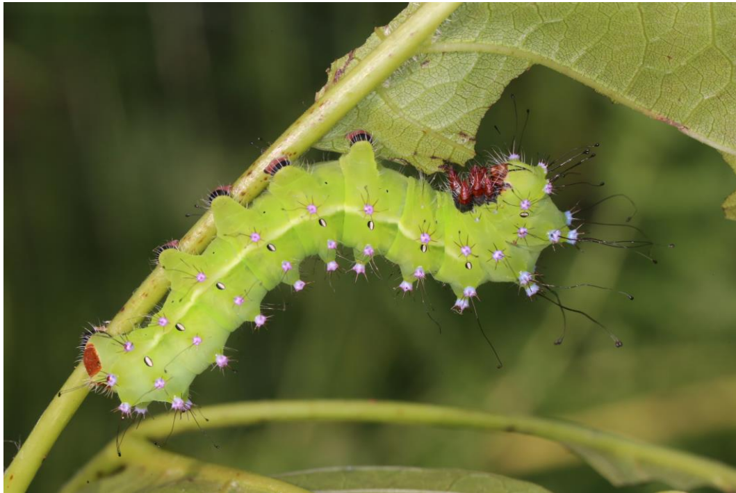
Obr. 2 Housenka.