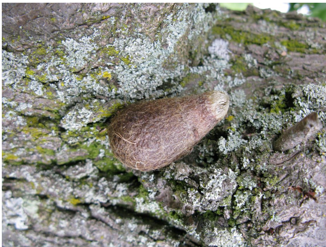
Obr. 3 Vzhled kokonu martináčů rodu Saturnia .